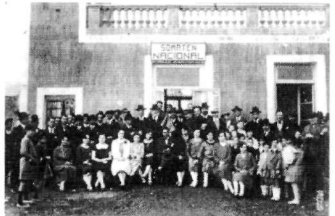
Somaten de Portman.