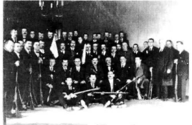
Somaten de La Unión.