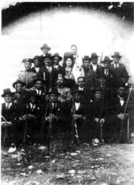
Somaten de Las Torres de Cotillas con su madrina