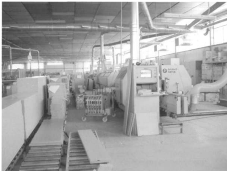
Fotografía n°4 industria robotizada. Joype (2008)

La industria actual tiende a organizarse en Polos Tecnológicos, en donde se instalan industrias de alta tecnología, esa orientación debe ser la seguida en los crecientes Polígonos industriales, no solamente construir naves dedicadas al proceso de fabricación, también labora-