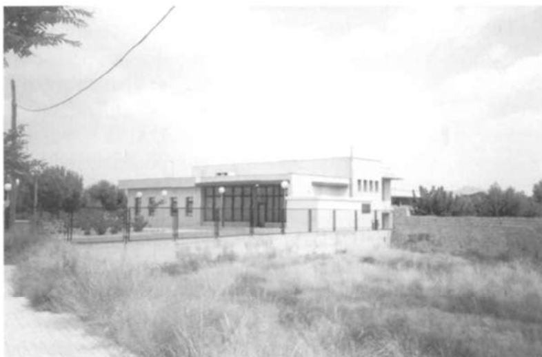
Foto nº1 Centro Tecnológico del Mueble de Yecla

Región de Murcia" (AREMA) y en otras asociaciones de índole semejante, resulta fundamental para la defensa del sector y para la realización de numerosas actividades que no serían rentables hechas por una única empresa. • En España sólo hay seis centros tecnológicos principales dedicados a la industria del mueble y Yecla cuenta con uno de ellos. En este centro se puede obtener la etiqueta de calidad controlada. Tras el cambio de estatutos en 2004 el CETEM (Centro Tecnológico del Mueble y la madera de Murcia) ha adquirido un ámbito territorial mayor, ya que ha pasado a nivel nacional.