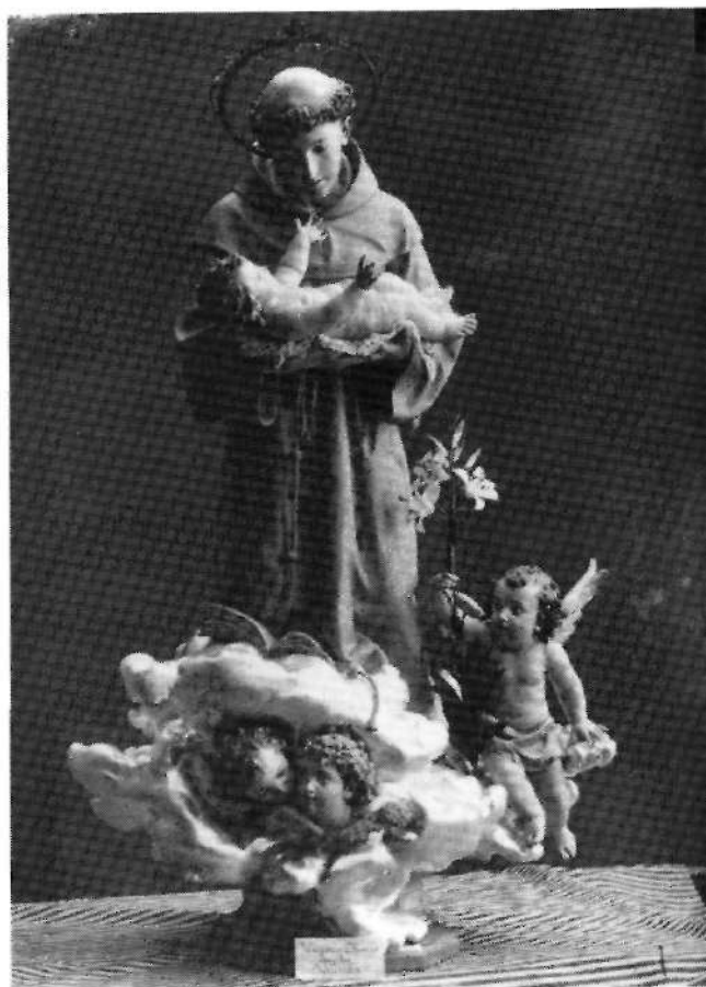
FIG. 7 - MARCO ROIG. Venancio: San Antonio de Padua . Obra escultórica de hacia 1905. Desaparecida.

En el presbiterio del lado del Evangelio mausoleo de piedra dedicado al prelado Antonio Ibáñez Galiano, obra del arquitecto valenciano José Juan Camaña y Laymon del año 1892 7 . Sobre dicho panteón gravitaba un busto labrado en