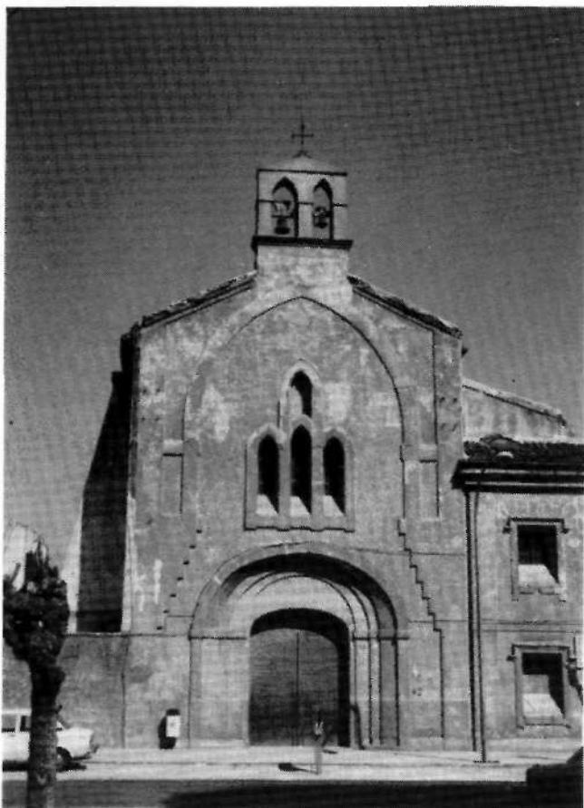
FIG. 4 - CAMAÑA Y BURCET, José Zacarías: Iglesia de Monjas Concepcionistas . Yecla. Fachada principal. Año 1875.

La iglesia , dedicada a la Inmaculada Concepción, es un edificio neogótico de una sola nave de planta rectangular dividida en seis tramos, que cubre con bóveda de crucería y presenta presbiterio de cabecera recta al que se adosa un