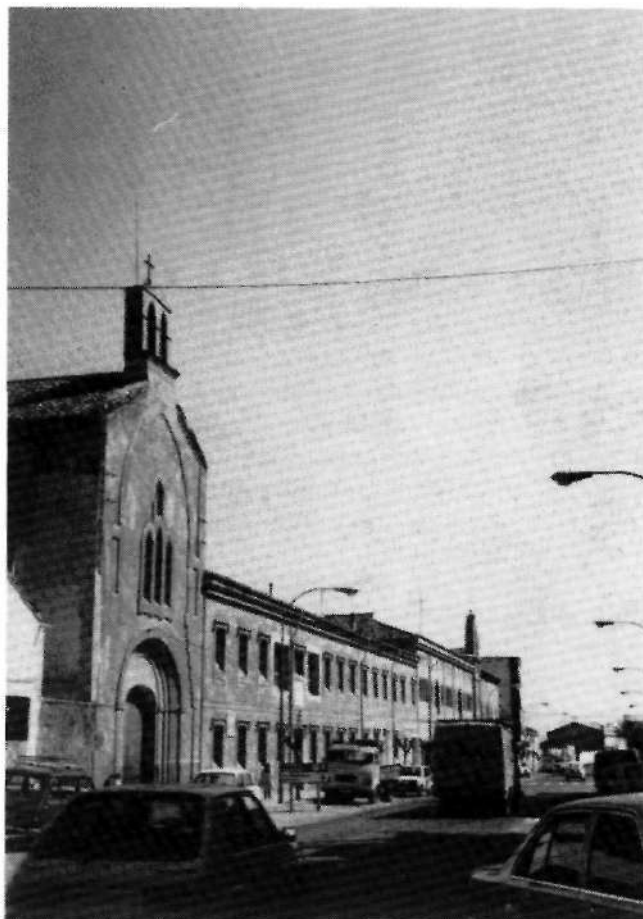
FIG.3-CAMAÑA Y BURCET, José Zacarías: Iglesia y Convento de Monjas Concepcionistas . Yecla. Año 1875. Fachada Principal

La fachada principal (FIG. 3) recayente a la calle presenta ventanas rectangulares impostadas, protegidas por enrejado cruciforme de forja, de idéntica sedación y distribuidas en dos plantas. En la baja, y centralizando la misma, puerta de ingreso adintelada surmontada por el escudo de armas del linaje del Cura Obispo Antonio Ibáñez Galiano, Caballero maestrante y comendador de la Real Orden de Carlos III, idéntico al que figura sobre su casa solariega de la calle de San Antonio, número 25. El blasón evidencia en su campo una torre con un puente, y en cuyos extremos dos perros, el uno frente al otro, tiran de/o sujetan una cadena. Como divisa o lema: "Por passar (sic) el puente me pondré a la muerte" .