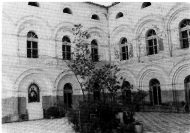
FIG. 2 - CAMAÑA Y BURCET, José Zacarías: Claustro del Convento de Monjas Concepcionistas . Yecla. Año 1875 (Foto Archivo Javier Delicado).

El cuerpo alto o segundo piso, de menor flecha o altura que los anteriores (las galerías baja y alta), estaba destinado al noviciado. Sobre una de sus paredes y pintado al fresco se hallaba representada la escena de la "Venida a Yecla de las monjas Concepcionistas y toma de posesión del convento".