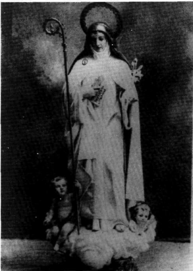
FIG 9 - LOPEZ PALAO, José Antonio; Beata Beatriz de Silva . Hechura de hacia 1900 (Fotografía antigua).

Tanto el mausoleo como el busto referidos quedan perfectamente documentados en las dos noticias relacionadas.