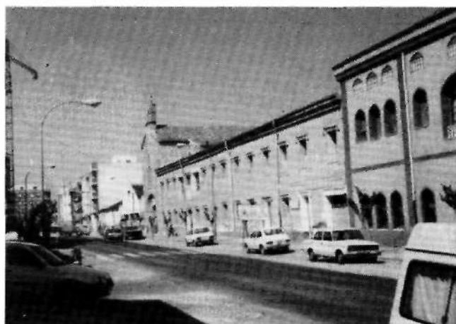
FIG. 1 - CAMAÑA Y BURCET, José Zacarías: Convento de Monjas Concepcionistas. Yecla. Año 1875.

La planta baja del edificio, con un solo ingreso por el centro de la fachada principal, se halla distribuida en un