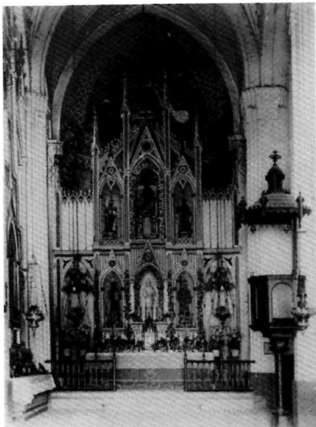
FIG. 6 - Retablo mayor desaparecido de la Iglesia de Monjas Concepcionistas. Yecla. Último tercio del XIX (Foto antigua totalmente inédita, cortesía de la Comunidad de Religiosas Concepcionistas).(Reproducción foto archivo Javier Delicado).

En el retablo mayor neogótico, de pobre factura (FIG. 6), imagen titular de La Inmaculada Concepción , talla policromada de autor desconocido de fines del siglo XIX. En el cuerpo inferior del retablo efigies de San Antonio de Padua (FIG. 7) del santuario Venancio Marco Roig, de hacia 1900 5 , de menor tamaño que el natural y de idéntica traza a la que ejecutó el artista para la Ermita de San Cayetano; y de San Pascual Baylón (FIG. 8) del escultor José Antonio López Palao, también de hacia 1900 6 , de menor tamaño que el natural y que debió sustituir la imagen de otro santo, Pedro de Alcántara (?). Y en el cuerpo superior del retablo imágenes de San José , con varal florido en la diestra y llevando al Niño Jesús sobre el brazo izquierdo, y de San Francisco de Asís portando un crucifijo en la mano derecha, ambas anónimas y del último tercio del siglo XIX.